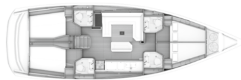
Version C 2 cabines avant, 2 cabines arrière / 4 salles d'eau