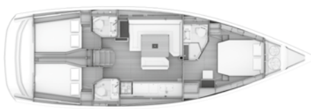
Version B Cabine propriétaire avant, 2 cabines arrière / 3 salles d'eau