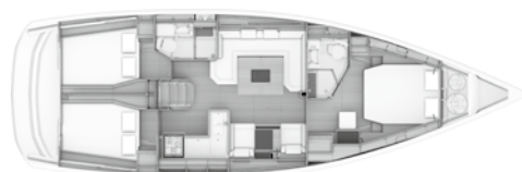
Version A Cabine propriétaire avant, 2 cabines arrière / 2 salles d'eau