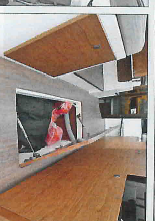
Les rangements sont nombreux à bord, à l'image de cette grande soule sous le plancher de la timonerie.