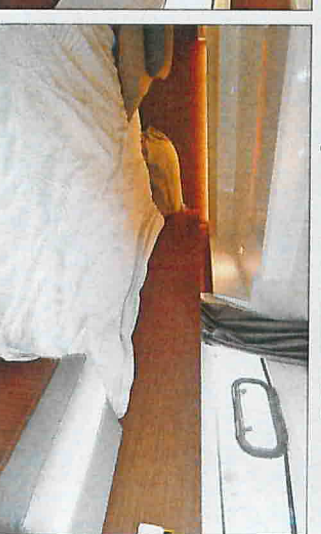
La deuxième cabine, placée sur bâbord au pied de la descente, reçoit un couchage de 1,97 mètre sur 1,37 mètre.