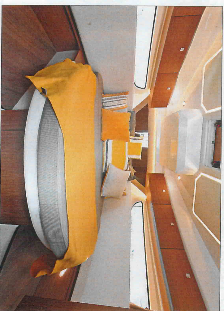
Le lit central dans la cabine avant est aisément accessible ; les meubles de rangement hauts sont facturés 1.200 €.

Nul doute que cet amiral mérite ses étoiles !