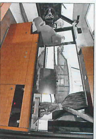
Le bloc-cuisine est installé derrière le siège pilote ; les rangements hauts sont optionnels.

La silhouette du 1095 rappelle celle du 895, malgré une étrave plus verticale.