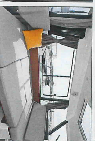
Le carré de timonerie se transforme rapidement en un couchage long de 1,98 et large de 1,10 mètre.