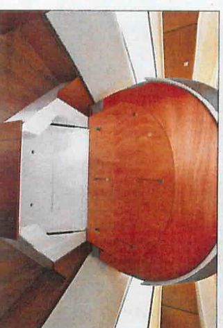
Le lit de la cabine avant se soulève facilement grâce à deux vérins, dévoilant alors un vaste coffre.