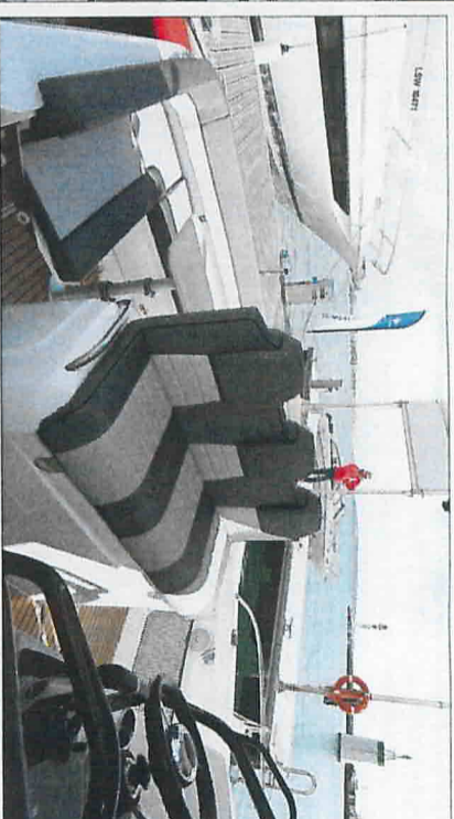
Trois personnes peuvent prendre place derrière le poste de barre. Dommage qu'il n'y ait pas de repose-pied pour le passager installé à babord et que les assises soient fixes.