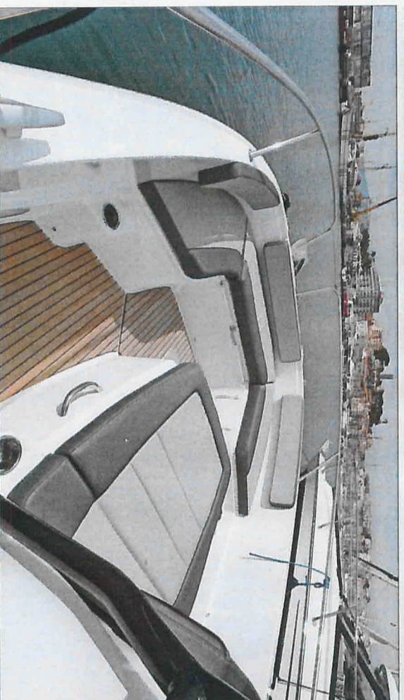
Les coussins et les dossiers du carré avant font partie du niveau de finition Première et permettent d'obtenir un agréable salon.