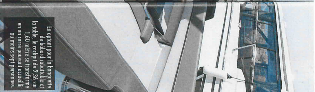
En option pour la banquette de babord rotative et la table, le cockpit de 2,36 sur 1,60 mètre se transforme en un carré pouvant accueillir au moins sept personnes.