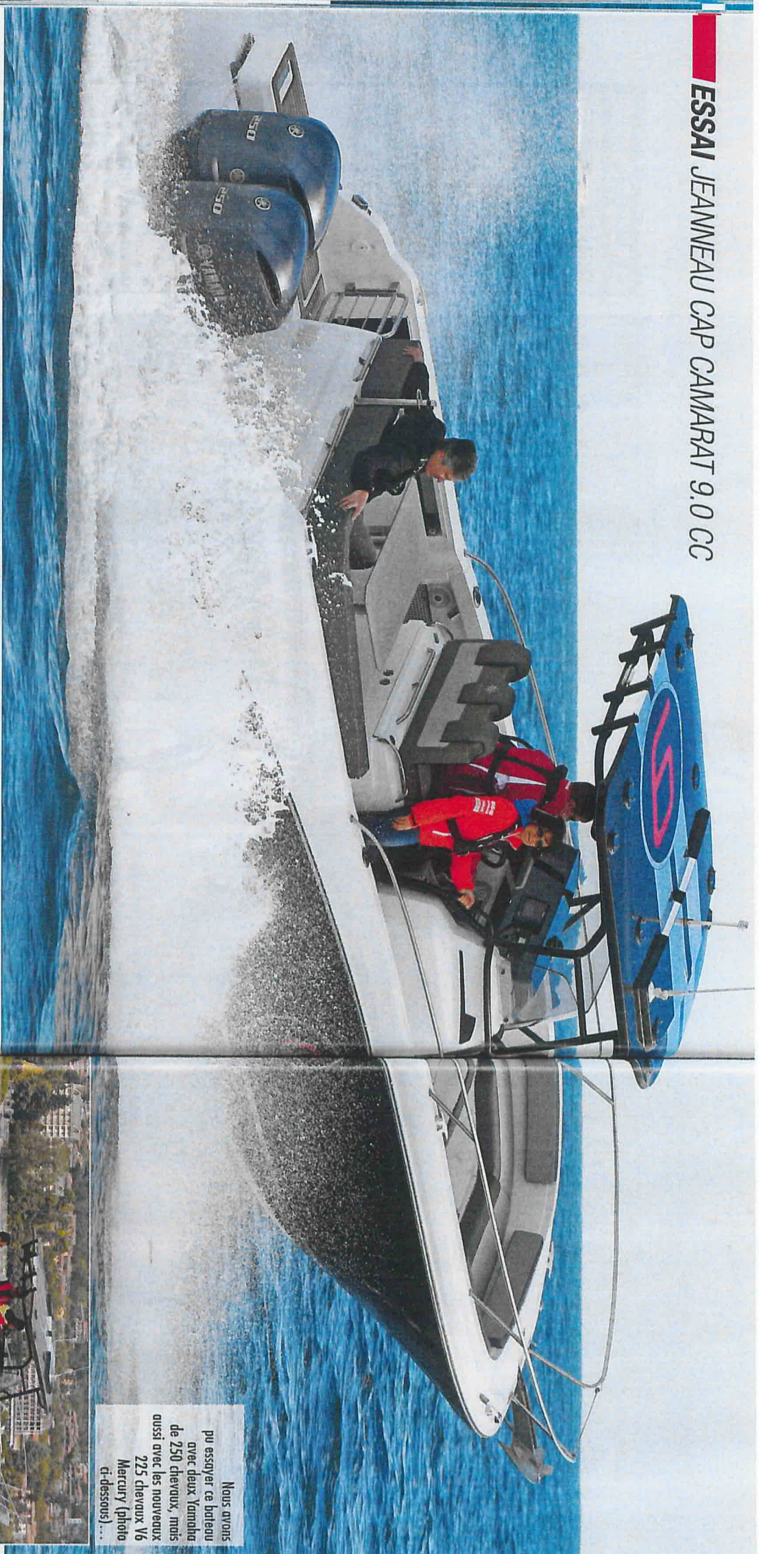
Nous avons pu essayer ce bateau avec deux Yamaha de 250 chevaux, mais aussi avec les nouveaux Mercury (photo ci-dessous)...