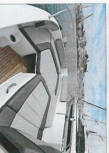
En option, un support en aluminium léger et deux coussins transformant l'avant en un bain de soleil de 1,67 sur 1,28 mètre.