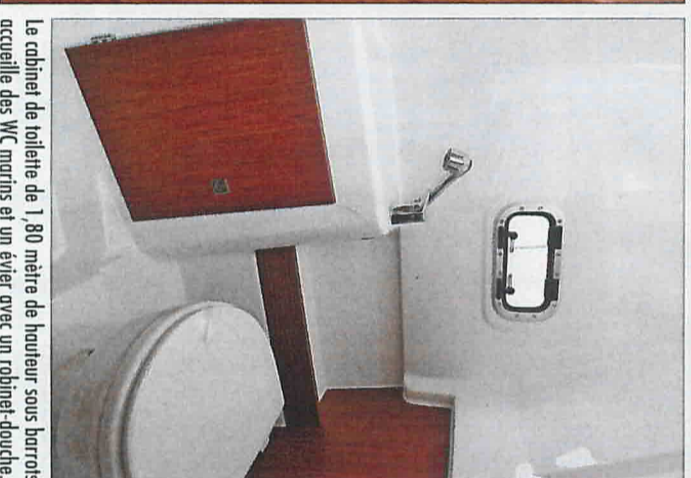
Le cabinet de toilette de 1,80 mètre de hauteur sous barrots accueille des WC marins et un évier avec un robinet-douche.

Côté aménagements, ce nouveau Cap Camarat fourmille d'astuces. Son cockpit est le même que celui de la version WA avec un carré de cockpit constitué de deux banquettes latérales rabattables et d'une grande table montée sur deux pieds hydrauliques permettant de l'abaisser facilement pour transférer le tout en un bain de soleil de 1,67 sur 1,28 mètre. Adossé à la