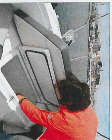
Sous le coussin central du carré avant se dissimule un coffre pratique pour le stockage des amarres et détenans.